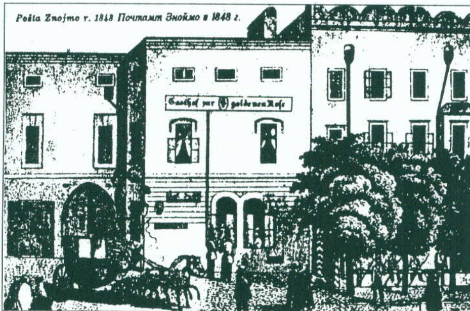
■ Pošta Znojmo (Horní náměstí) v roce 1848.

Psaníčka jsou bílá jako pel a čekají na vlaky, lodě a člověka, aby jak čmelák a vítr je do dalek rozesel, tam, kde jsou srdce, blizny červené, schované v růžovém okvětí. Když na ně psaní doletí, narostou na nich plody sladké nebo trpké.